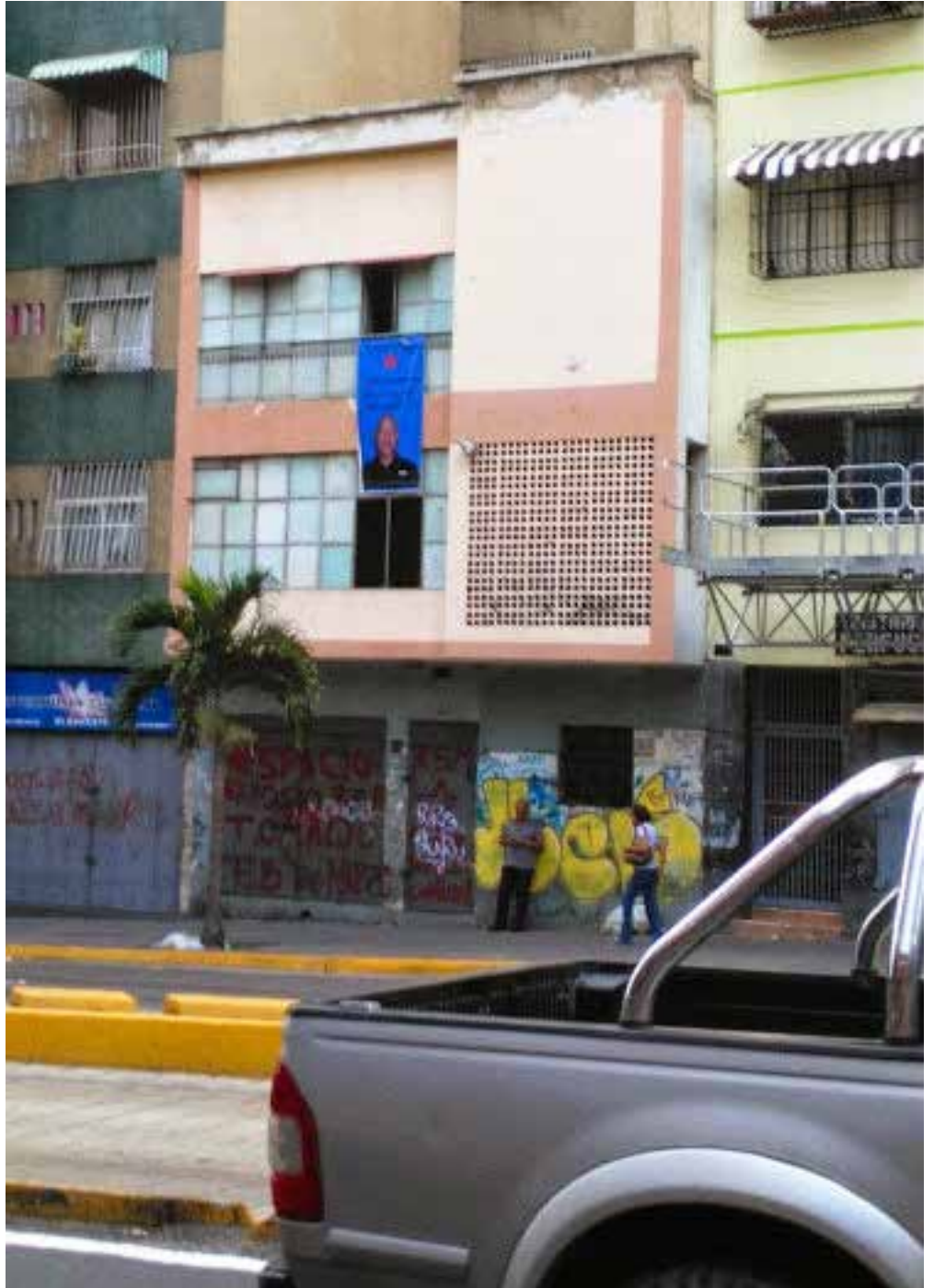
Invasión a la antigua sede del The Daily Journal por parte del Colectivo 5 de Marzo.